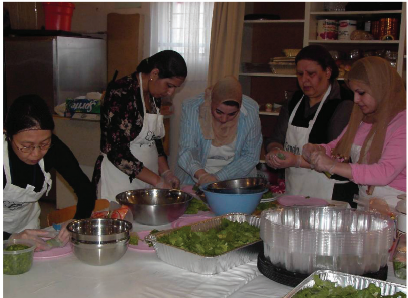
Women working in the kitchen at EthniCity Catering enhance English language skills while gaining Canadian work experience.